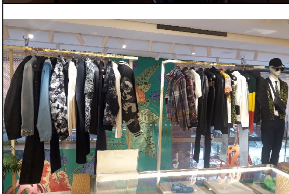
Almacén de L V COLOMBIA SAS ubicado en el C.C. Andino. Detalle del segundo piso donde se ubica la Línea masculina del almacén.