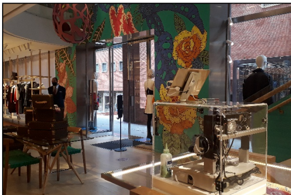
Punto de venta de L V COLOMBIA SAS ubicado en el Centro Comercial Andino – Cra 11 N° 82-01 LC 4. Detalle de la entrada principal del almacén, vista interna.