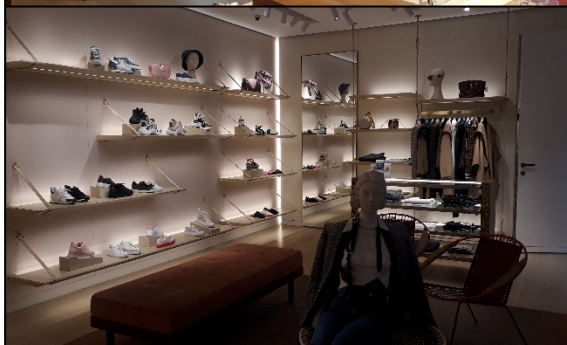
Almacén de L V COLOMBIA SAS ubicado en el C.C. Andino. Detalle de la planta baja (primer piso) donde se ubica la Línea femenina del almacén.